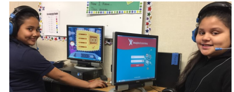
Nuevas tecnologías para promover el aprendizaje en inglés y español