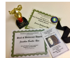
Premios y reconocimientos para los alumnos del Programa de lenguaje de doble inmersión durante “La gran celebración”.

Los alumnos aprendices de inglés (EL) en el Programa de lenguaje de doble inmersión, tendrán las mismas oportunidades para reclasificarse como proficientes en inglés que los aprendices de inglés en otros programas.