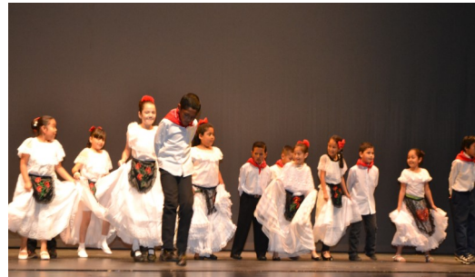
Alumnos del programa en "La gran celebración"